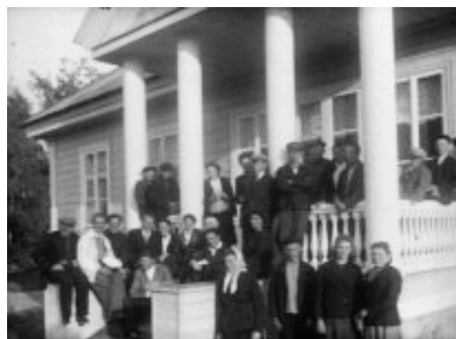
Коллектив сотрудников Пушкинского заповедника на балконе дома-музея А. С. Пушкина в Михайловском